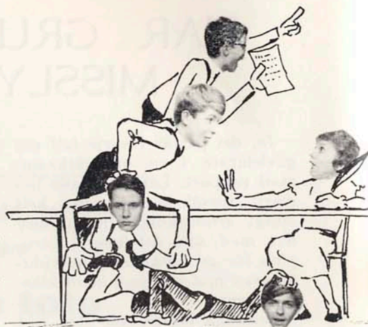
Eleverådsstyrelsen anno 1965: